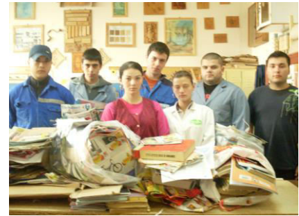
Elevii clasei a-XII-a B - au colectat 260