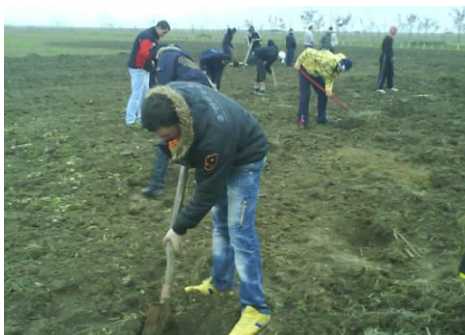
Elevii clasei a-XI-a. A. – au plantat salcâmi