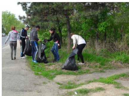
Elevii clasei a-XII-a A. Au participat la campania de ecologizare a padurii “Stejaru” din cadru Oolului