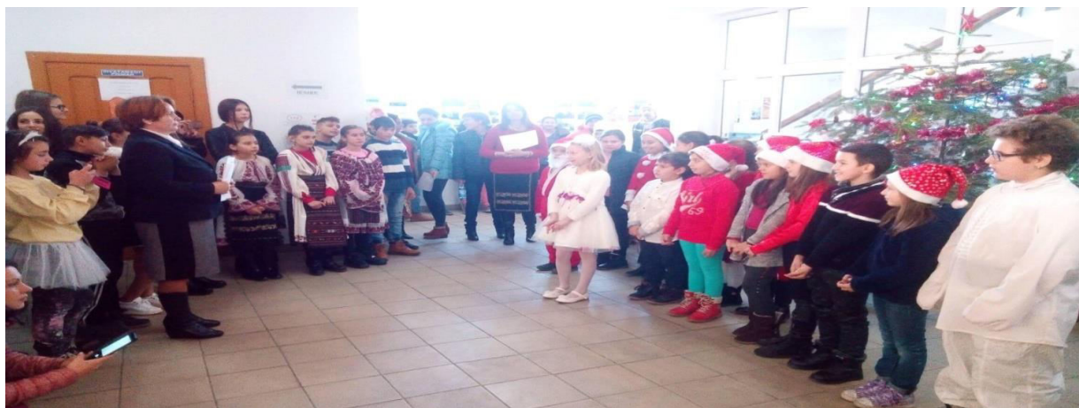
Poza 1 Bucuria sărbătorilor de iarnă la Școala Gimnaziala Sîmbotin, comuna Schela, județul Gorj