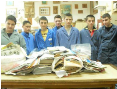
Elevii clasei aXI-a.B - au colectat 180 kg hârtie

Elevii claselor: a-XI-a A & a-XII-a. A Tehnician ecolog; a-XI-a. B. Designer mobilier; a-XII-a. B. Tehnician prelucrarea lemnului au participat la campania de: colectare hârtie, ecologizare & plantare a pomilor în municipiul și județul BRĂILA.